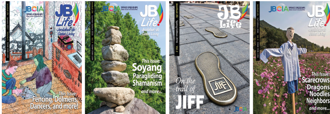
전라북도 영문 홍보잡지