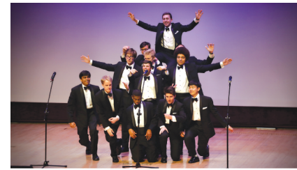
한국국제교류재단 공모사업 추진