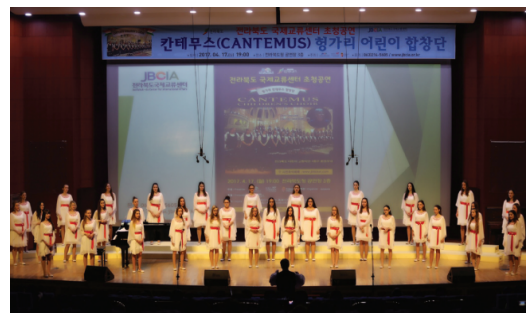
한국국제교류재단 공모사업 추진