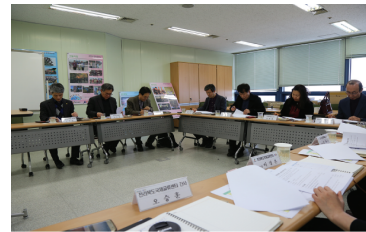
전북 국제교류 지원회