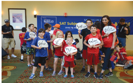
해외 민간교류 활성화 지원사업